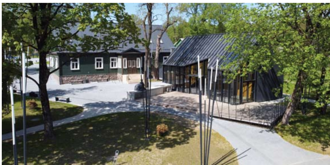
Naujas, modernus restorano pastatas Tilto gatvėje, visai šalia Šventosios upės, vis dar neranda šeiminko.