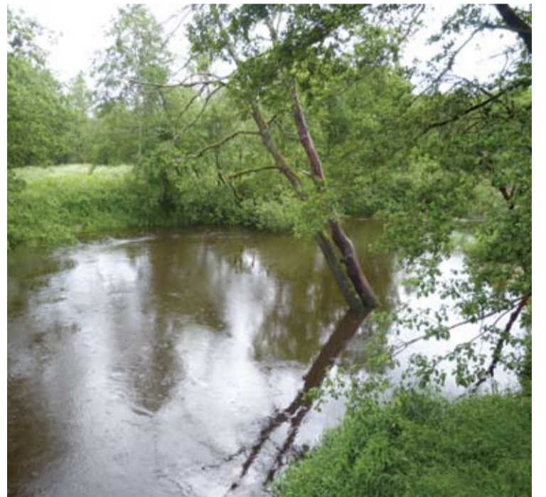
Jara ties Vikonimis.