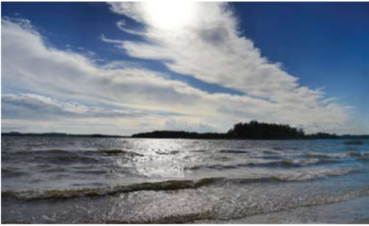
„Kodėl ne jūra?“, 2018 m..