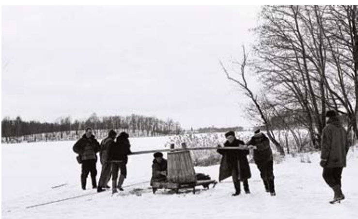
Įvadinės knygos nuotraukos darytos dar juostiniu fotoaparatu.

Žinia, knygų leidimas nėra pigus malonumas. Kainuoja ne tik spaudos darbai, taip pat ir produkto rengimas spaudai, nes prie jo turi dirbti visa profesionalų komanda.