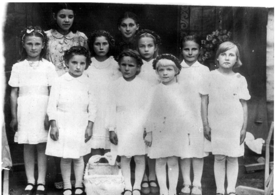
„Angelaičių“ mergaitės per atlaidus Kavarske barstydavo gėlytes, šokdavo Joninių šventėje.