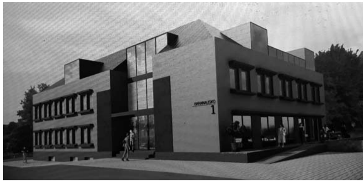
Taip po rekonstrukcijos turėtų atrodyti A. Baranausko aikštės Nr.1 pastatas.

Projektiniuose pasiūlymuose rašoma, kad, rekonstruojant šį