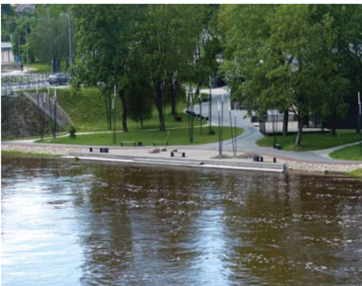
Šventoji buvo susiruošusi vėl aplankyti Tilto gatvės kompleksą.