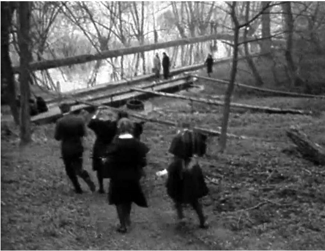
Kavarsko šaltinis su mediniais latakais (iki restauravimo). Tikėta, kad per Jonines vanduo įgauna sveikatinimo galių.