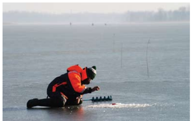
„Kur mano auksinė žuvelė?..“, 2014 m..