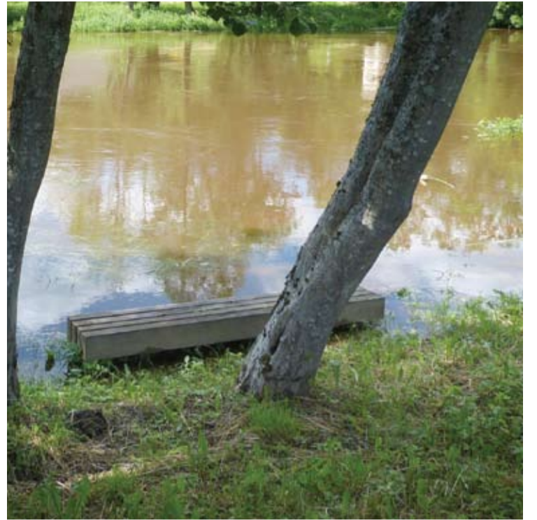
Gera vieta kojoms nusimazgoti... Šventoji žemiau Anykščių.

Beje, Traupyje, šalia Nevėžio, gyvenantis S. Obelevičius ir pats „Facebook“e dalijosi šios upės nuotrauka su prieraišu - „Kaip kažkada pasakė skandalingasis politikas, „Niavėža tože upa“. Po liūties Nevėžis ties Traupiu pakilo 2,5 metro. Net maudytis baisoka“, - „Facebook“e juokavo meras.