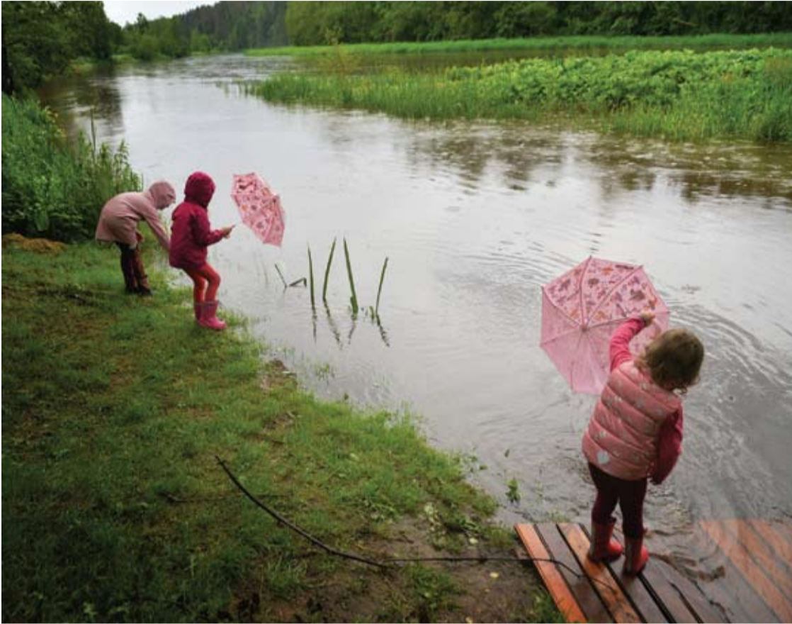
Šventoji aukščiau Anykščių. Lieptas atsidūrė po vandeniu.

Birželio 19-22-ąją Anykščiuose iškrito per 60 milimetrų kritulių, arba dešimtadalis metinės kritulių normos. Šventosios upės vandens lygis Anykščių stebėjimo poste buvo pasiekęs 124 cm atžymą, viršijančią vidutinę daugiametę ribą. Vanduo Šventojoje pradėjo slūgti tik naktį iš birželio 22-osios į 23-iąją (iš trečiadienio į ketvirtadienį).